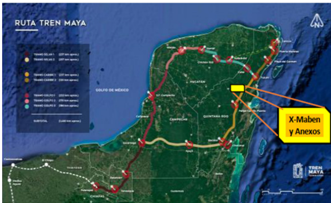
Localización del ejido en la ruta del Tren Maya

Nota: Tomado y modificado del anexo técnico de Información del Proyecto Tren Maya, disponible en https://www.gob.mx/cms/uploads/attachment/file/513993/TM_ANEXO_TECNICO_VF2__1_.pdf