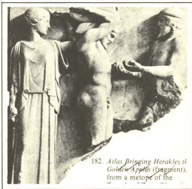
182. Atlas Bringing Herakles the Golden Apples (fragment), from a metope of the

única que hace poderosa la palabra, que se animara su gastada y egoísta nación al impulso de su particular patriotismo, y, a pesar de todo, Atenas bajara de nuevo a la arena para defender con las vidas de los suyos la libertad amagada por Filipo, asentó Demóstenes su grandeza. El lado trágico de ésta aumenta la fascinación en quien penetra las ilusiones del gran orador y advierte el mejor derecho que, históricamente hablando, pertenecía a Filipo; pero el fuego de la pasión de Demóstenes arrebató a ese mismo juez. Pero muy otro es el encanto al que los retóricos eran sensibles. Lo que les pasaba es lo que al principio le hace perder nuestras simpatías. El arte helénico cohibía toda pasión y rudeza y la reducía a la mayor y más armoniosa lisura. Demóstenes no habló de este modo, de ello tenemos certidumbre. Como escritor practicó el arte de los convencionalismos con el mejor juicio y la más cauta inteligencia; advertimos que ese orador puede ser lo que le plazca, pues su poder no conoce límites; pero él mismo define los angostos límites compatibles con el desarrollo de la armoniosa belleza, una belleza, si se quiere, del estilo empleado por el arte contemporáneo en el adorno de mausoleos; pues en el caso de