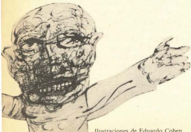
Ilustraciones de Eduardo Cohen

(De la exposición "Sarcasmos y desacatos", pasteles, tintas, crayones, 1989)