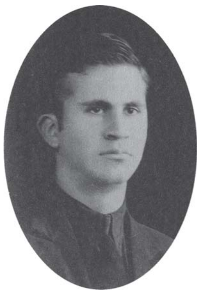
Eli de Gortari

ÉSTE ES UN espacio abierto a la comunidad de nuestra Facultad. Les invitamos a que nos escriban sus opiniones y sugerencias (máximo media cuartilla) a la siguiente dirección electrónica: meta_te@yahoo.com.mx, o directamente a la Secretaría Académica o a la Secretaría de Extensión Académica. ◆