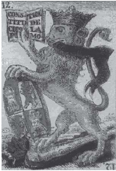
Cartas de baraja conmemorativa de la Constitución de Cádiz.