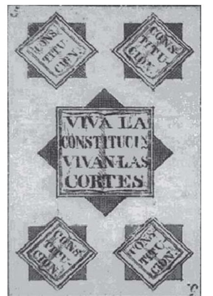
Cartas de baraja conmemorativa de la Constitución de Cádiz.